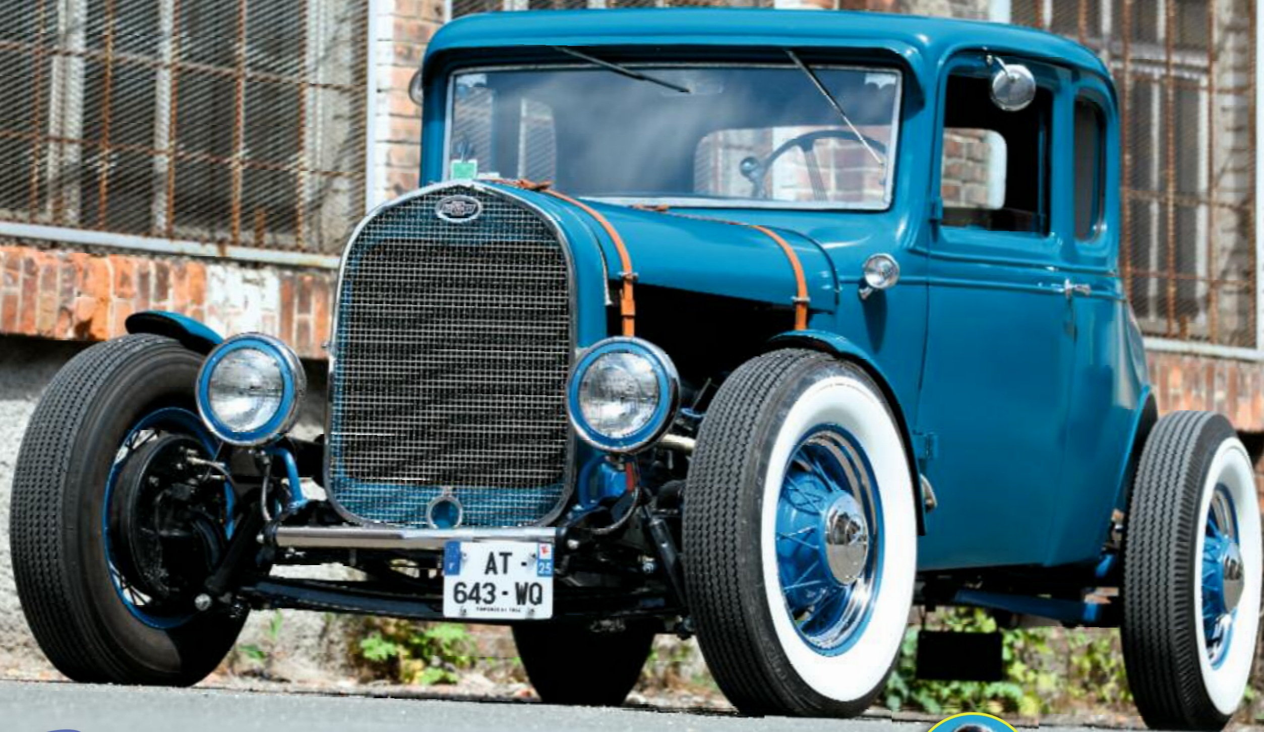
CHEVROLET 32 COUPÉ 5 FENÊTRES